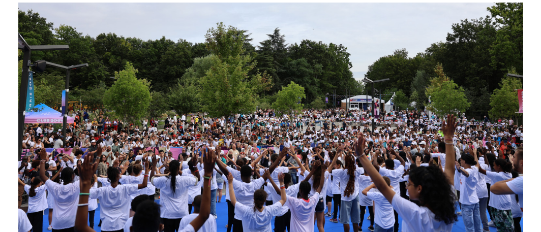
Arrivée de la flamme olympique à Tremblay-en-France.

où l'on agit concrètement contre le réchauffement climatique en refusant le tout béton avec des circulations, des transports dignes de notre ville dotée de commerces de proximité de qualité.